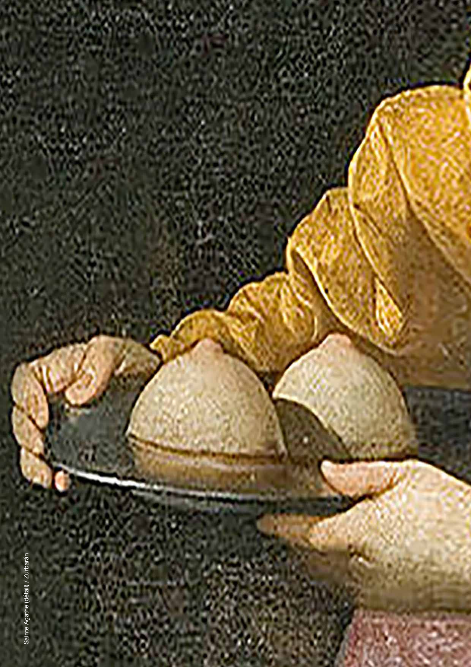
Sainte Agathe (détail) / Zurbarán