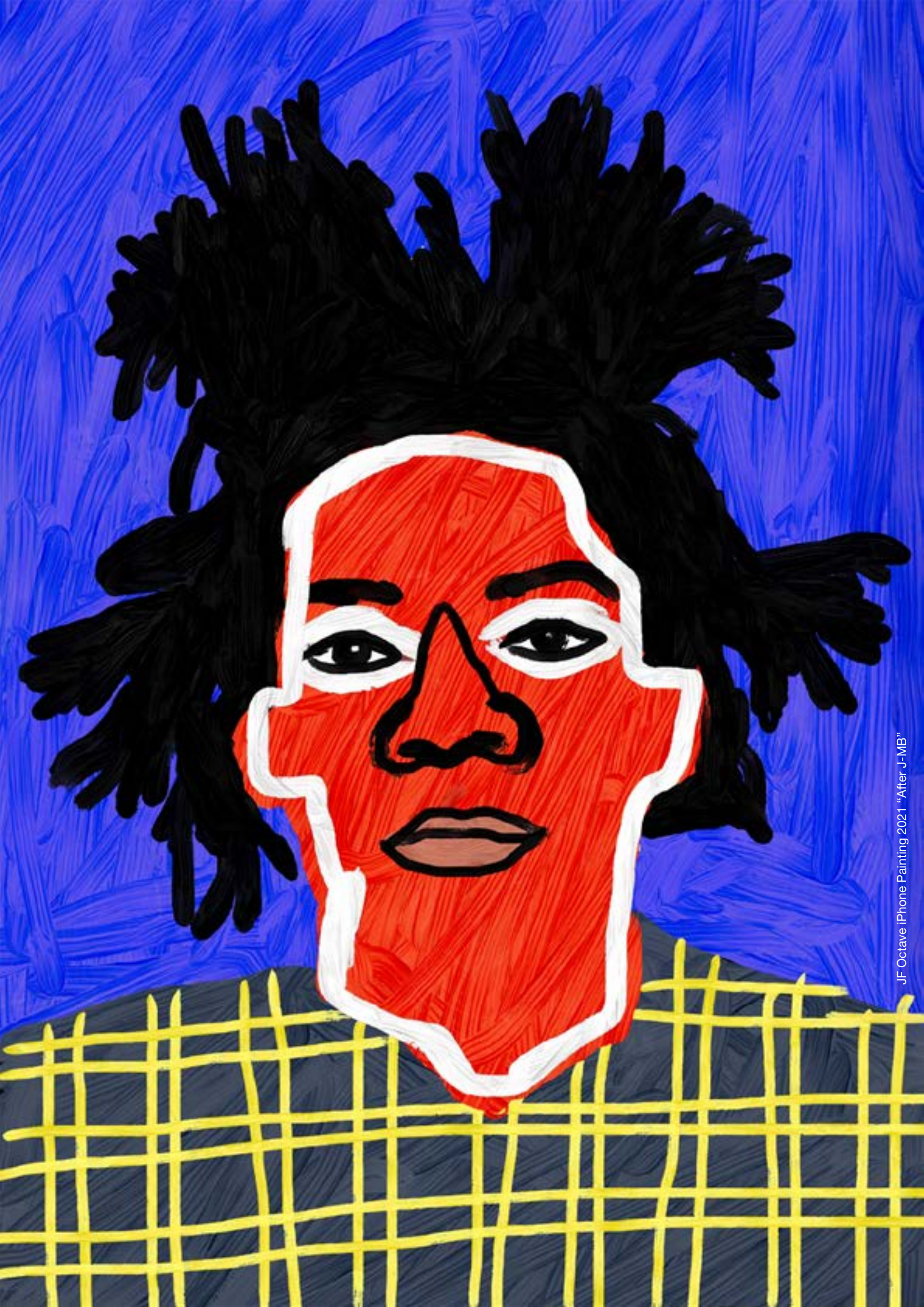
JF Octave iPhone Painting 2021 "After J-MB"