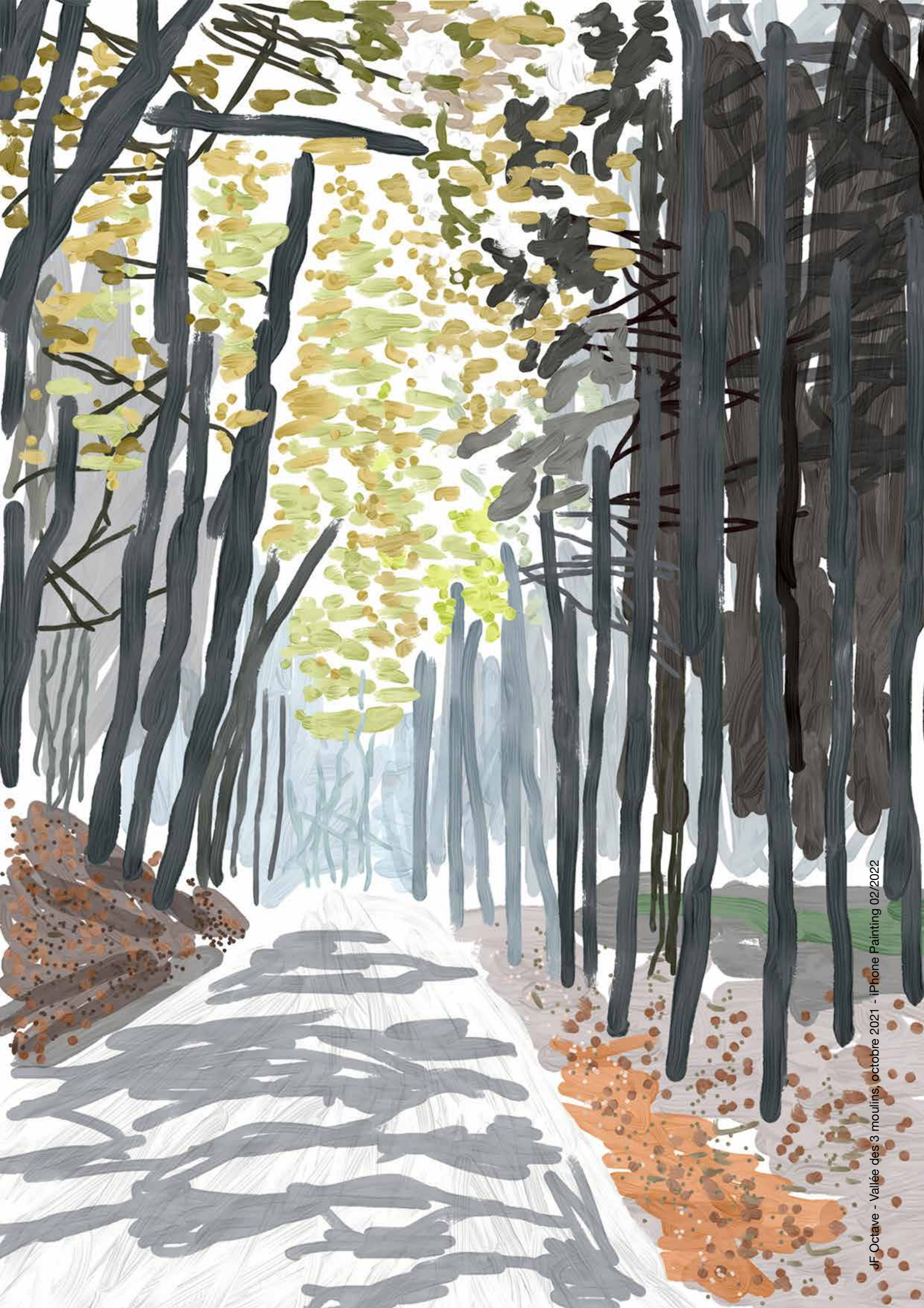
JF Octave - Vallée des 3 moulins, octobre 2021 - iPhone Painting 02/2022