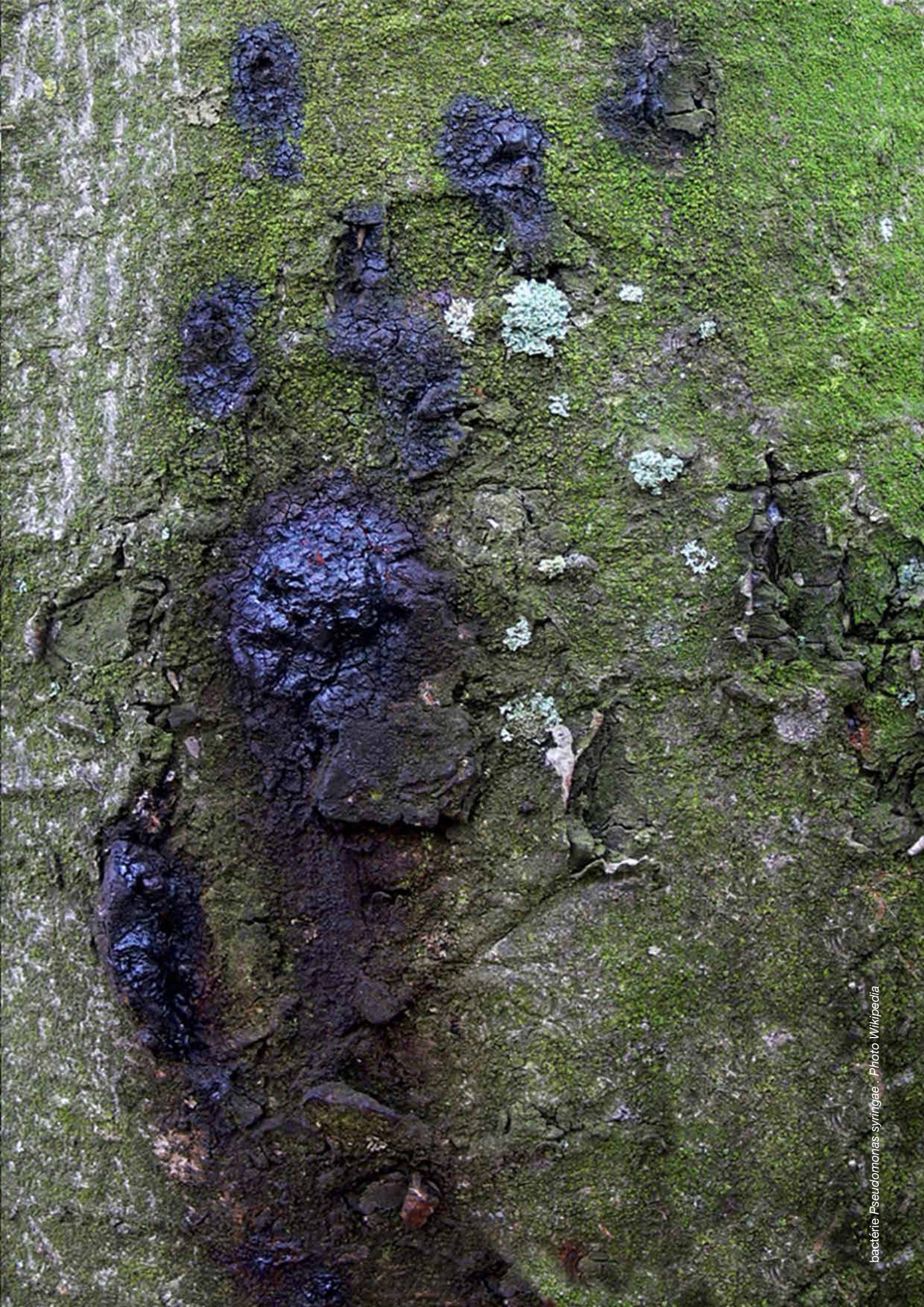
bactérie Pseudomonas syringae .