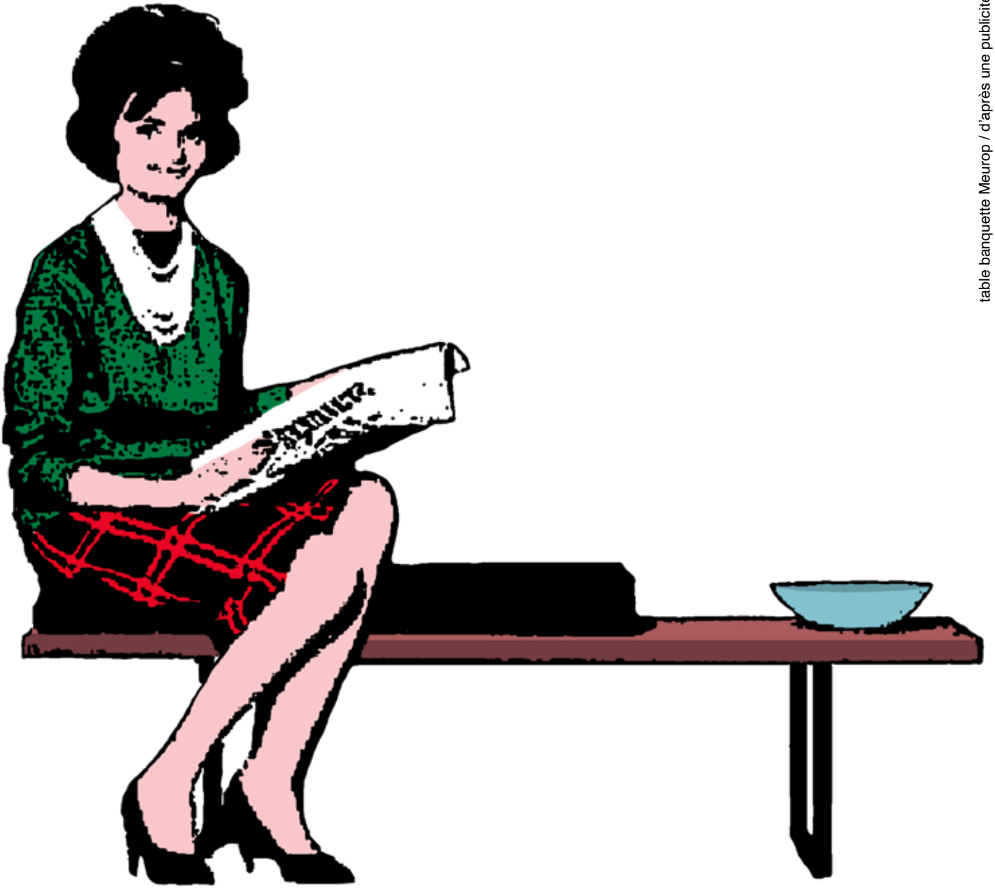
table banquette Meurop / d'après une publicité d'époque