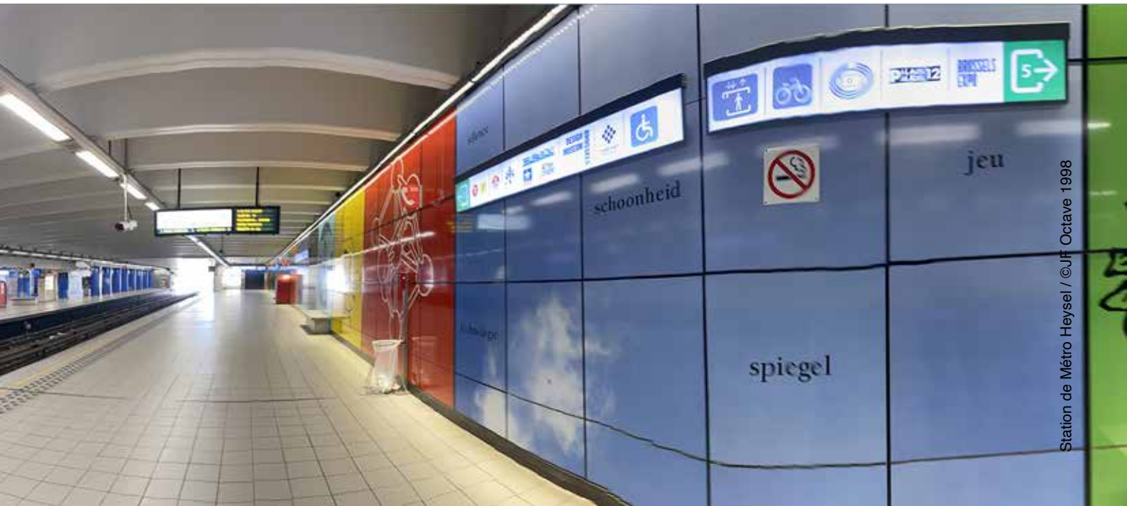
Station de Métro Heyssel