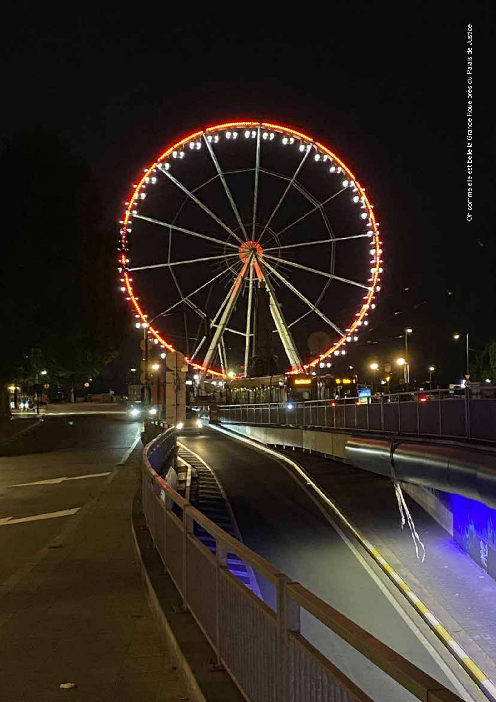
Oh comme elle est belle la Grande Roue près du Palais de Justice