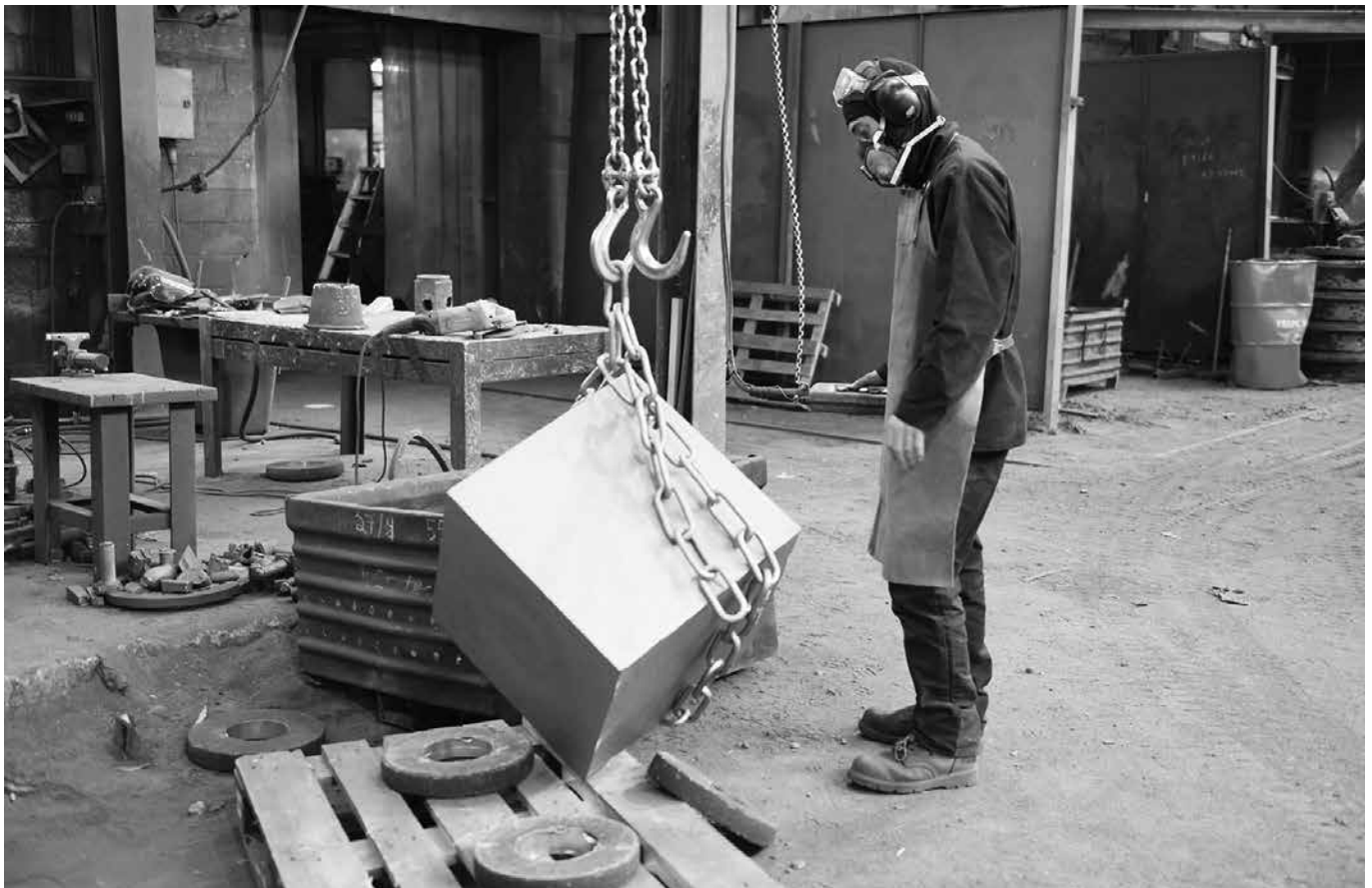
↑ Teresa Margolles, One ton of steel from an abandoned factory of Charleroi, 2019. © Teresa Margolles