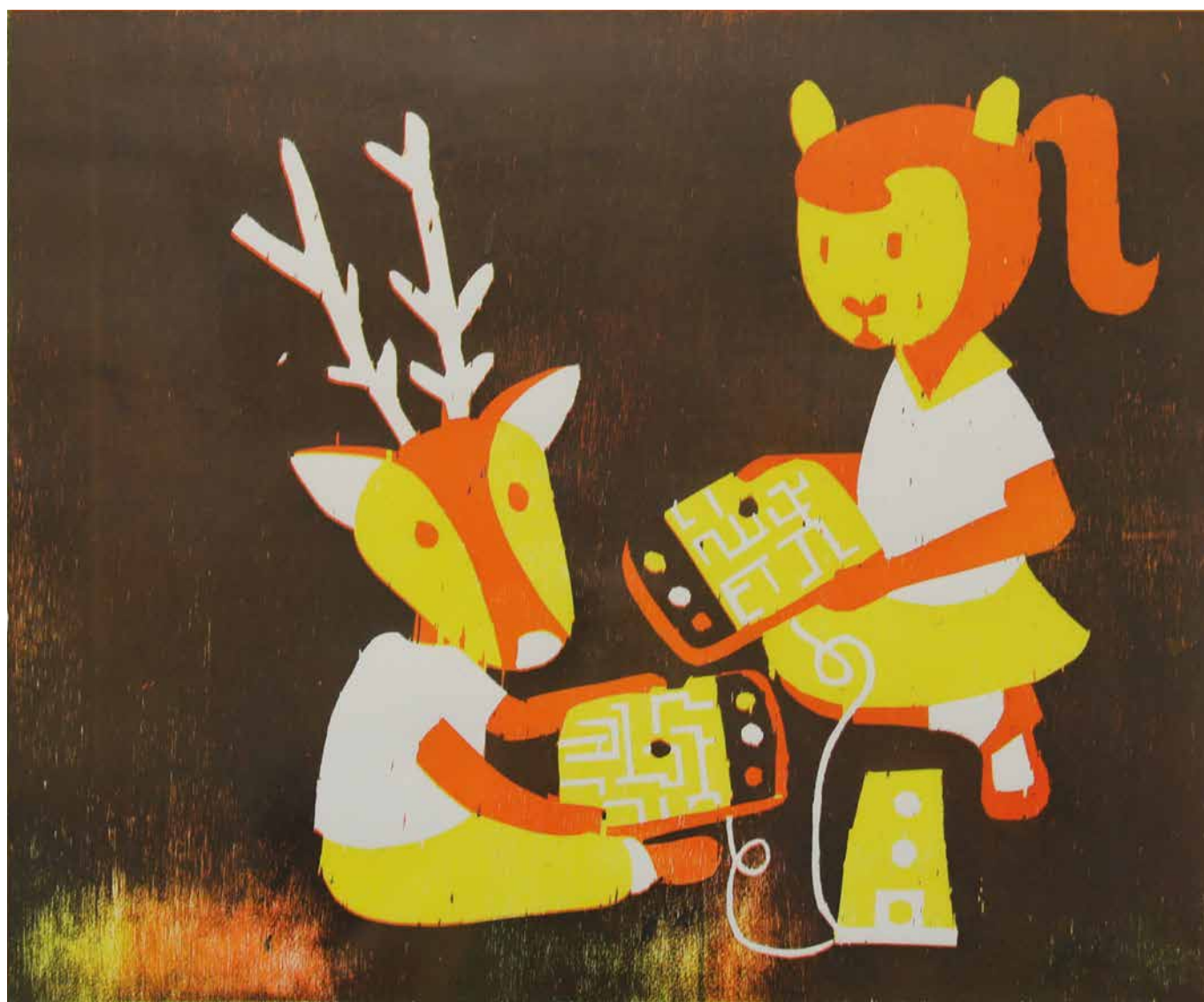
↑ Laurence Gony, Jeu avec l'enfant , 2006. Collection de la Province de Hainaut en dépôt au BPS22