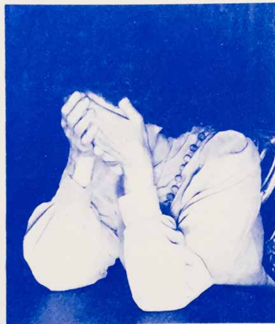
Figure 6. La technique de la relaxation à l'aide des paumes.